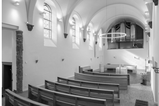
Der Kirchenraum heute (© Irina Jansen, Höxter).